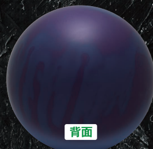
軌道図と表裏写真